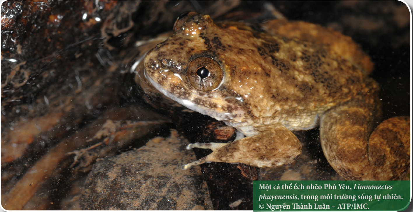
Một cá thể ếch nhẽo Phú Yên, Limnonectes phuyenensis , trong môi trường sống tự nhiên.

Để theo dõi những thông tin mới nhất về công tác bảo tồn rùa cạn và rùa nước ngọt Việt Nam, vui lòng ghé thăm website: www.asianturtleprogram.org