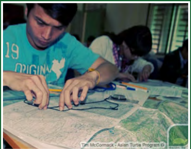
Các học viên học cách đọc và định hướng trên bản đồ trong bài giảng sử dụng bản đồ.