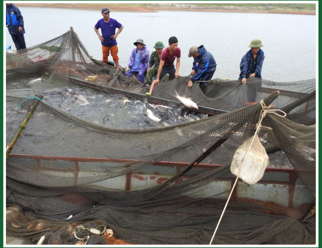
Sau 5 lần kéo lưới, các ngư dân đã thu về tới 30 tấn cá.

Facebook: www.facebook.com/AsianTurtleProgram