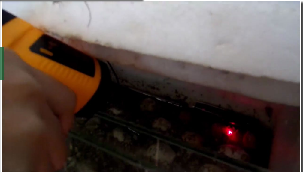
Một ngày ở Trung tâm Bảo tồn Rùa – Vườn Quốc gia Cúc Phương, Việt Nam.