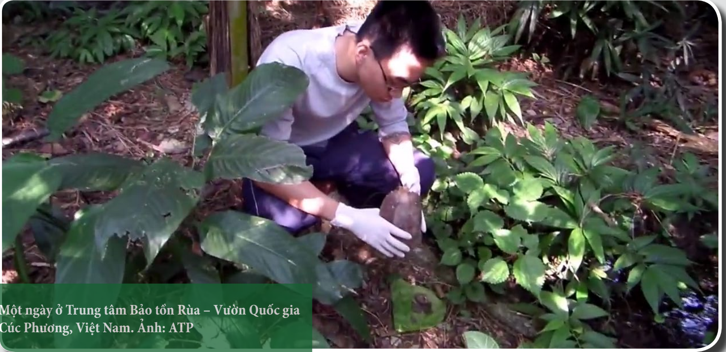
Một ngày ở Trung tâm Bảo tồn Rùa – Vườn Quốc gia Cúc Phương, Việt Nam.

Để theo dõi những thông tin mới nhất về công tác bảo tồn rùa cạn và rùa nước ngọt Việt Nam, vui lòng ghé thăm website: www.asianturtleprogram.org www.cucphuongturtlecenter.com