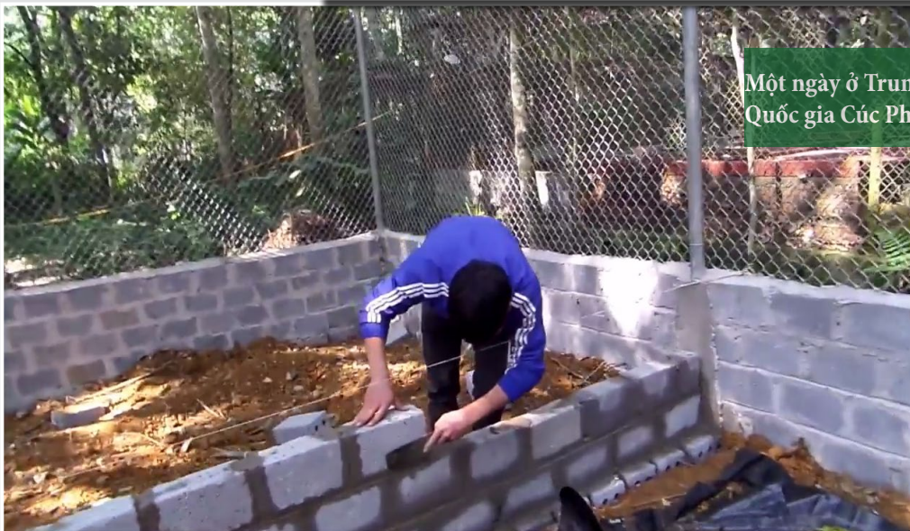
Một ngày ở Trung tâm Bảo tồn Rùa – Vườn Quốc gia Cúc Phương, Việt Nam. Ảnh: ATP

Để biết thêm chi tiết, vui lòng liên hệ Chương trình bảo tồn rùa châu Á - Tổ chức Indo-Myanmar Conservation Phòng 1806, tòa nhà Bắc Hà C14, đường Tố Hữu, quận Nam Từ Liêm, Hà Nội, Việt Nam Hòm thư 46 Điện thoại: +84 (0) 4 7302 8389 Email: info@asianturtleprogram.org Website: www.asianturtleprogram.org Facebook: www.facebook.com/AsianTurtleProgram